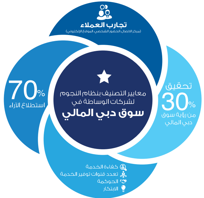
Figure 1: DFM Brokers Excellence Rating Model

يتضمن نموذج التقييم المبين في الشكل (1) المعايير ونسبتها المئوية. هذا ويتألف النموذج من شقين، الأول يعكس "تجربة العميل" والذي يمثل 70% من إجمالي التقييم، أما المعيار الثاني هو "تحقيق رؤية سوق دبي المالي" ويمثل ذلك 30% من إجمالي التقييم. ذلك بالإضافة إلى التغذية الراجعة والمُدخلات المتمثلة في تقارير المتسوق السري (Mystery Shoppers) ونتائج أخرى تم الحصول عليها من تقييم الموقع الإلكتروني ومراكز الاتصال وتجربة العميل الميدانية بالحضور الشخصي. أما الشق الثاني المتمثل في تحقيق رؤية سوق دبي المالي، ويشمل ذلك كفاءة الخدمة، تعددية قنوات الحصول على الخدمة، والحوكمة، والابتكار.